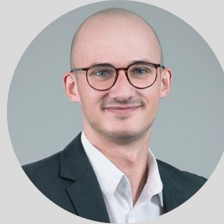
Jörn Rottmann Consulting