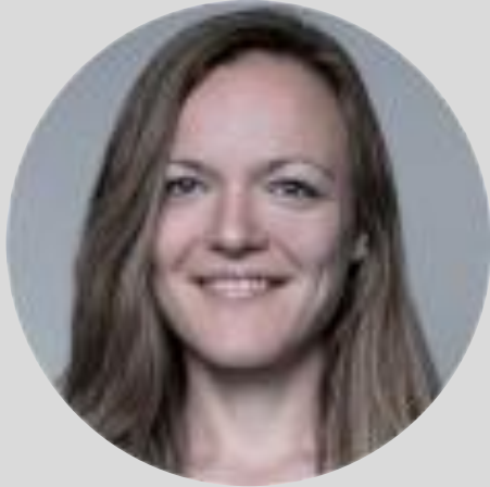
Emilia Kallenberg Consulting